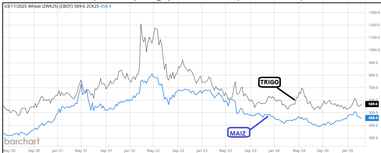
Gráfico 1: Precios Futuros (marzo 2025) de Trigo y Maíz 2020 – 2025 (al 17 marzo 2025)

Los precios futuros del maíz y el trigo para marzo de 2025, que habían mostrado una recuperación desde comienzos de año, cambiaron su comportamiento a mediados de febrero, pocos días después de la publicación del Informe Cereales SNA N°2 2025. Esto ocurrió cuando EE.UU. comenzó a concretar los ajustes arancelarios y los países afectados anunciaron sus medidas de respuesta.