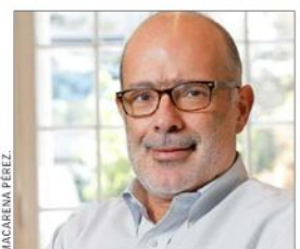
Rodrigo Valdés, exministro de Hacienda.